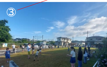
♪新しい朝が来た、希望の朝だ～ 子供と一緒にみんなで 1・2・3！