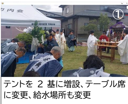
テントを2基に増設、テーブル席に変更、給水場所も変更