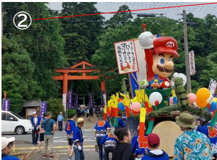
スーパーキノコでパワーアップ！ マリオのように元気モリモリ！