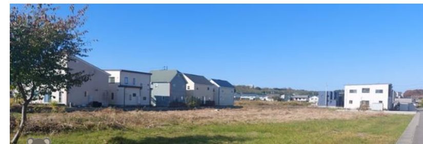
見通しが良くなり、クマ出没の抑止効果もあったと思われる、6班～7班間の空き地

【班長ヒアリング】 全体的に高齢化が進んでおられるので、業務や班長業務など課題も出てきています。課題と